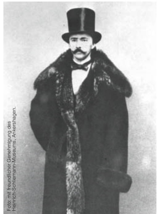
Foto: mit freundlicher Genehmigung des Heinrich-Schliemann-Museums, Ankershagen.

Lithografie von Wilhelm Heuer. Mit freundlicher Genehmigung der Schröder-Stiftung, Hamburg.