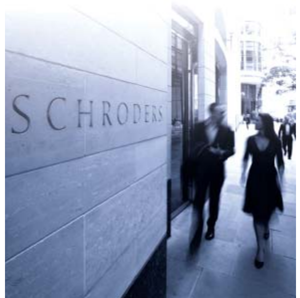
Schrodgers im Londoner Bankenviertel , zwischen St. Paul's Cathedral und der Bank von England.

Heute gibt es Schrodgers in der City noch als angesehene Vermögensverwaltung mit Privatbankgeschäft. (...)