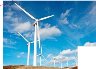
Erneuerbare Energien, Energieeffizienz