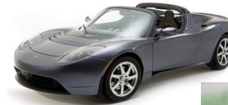
Transport und Verkehr