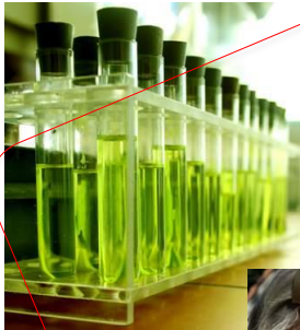
Gesundheit, Business, Medizin